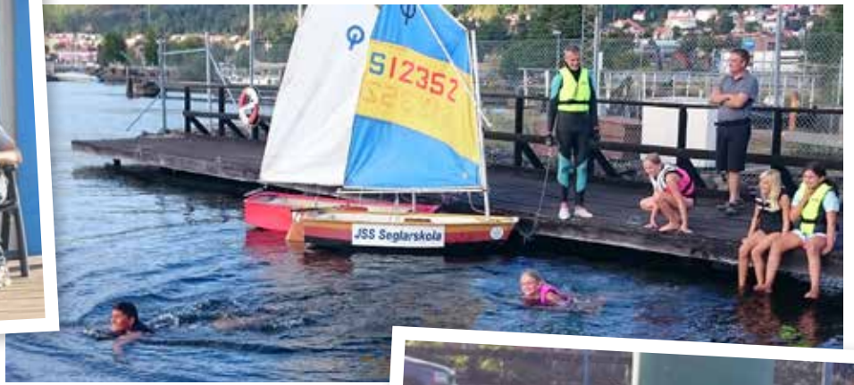
Inte är det för kallt att bada