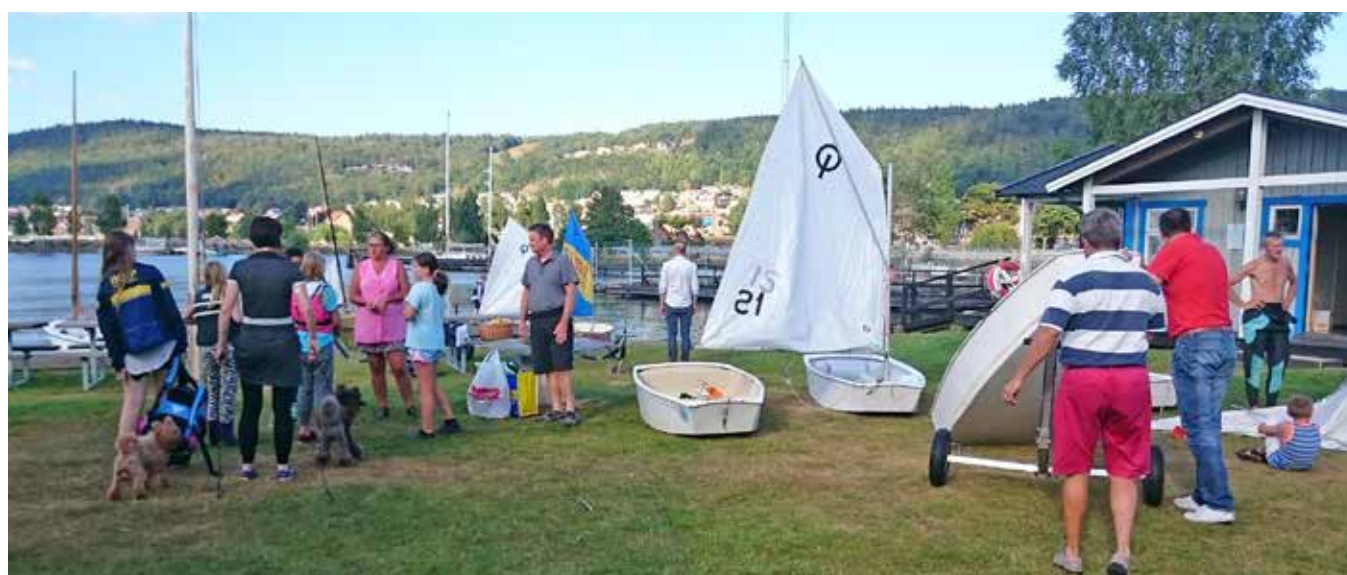
Ungdomarna instrueras medan föräldrar fixar rigging och sjösättning