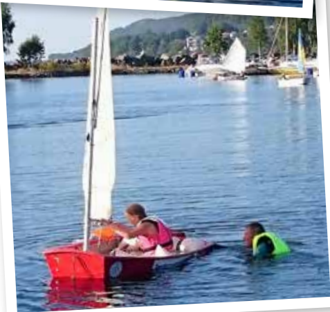
Christian övervakar att jollen länsas