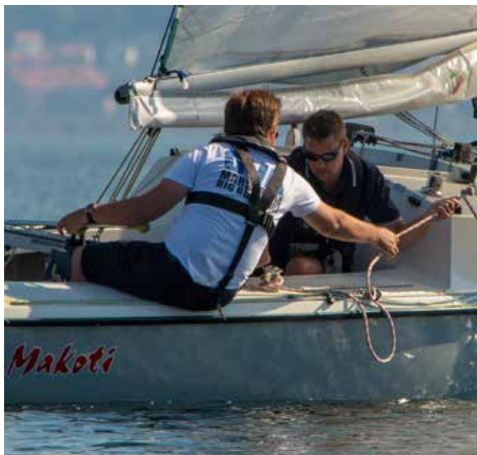
Fyra foto: PA Axen