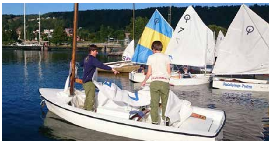
Man skall lära sig rigga också