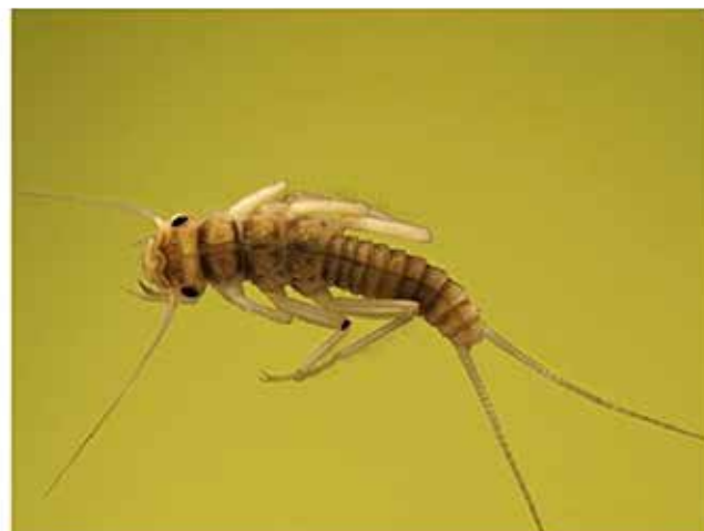
Figur 11. Jättebäcksländan Dinocras cephalotes , till vänster och bäcksländearten Diura bicaudata , till höger, © Medins Havs och Vattenkonsulter AB.

MARINKAPELL VÄTTERN 0708-17 66 22 marinkapellvattnen.se