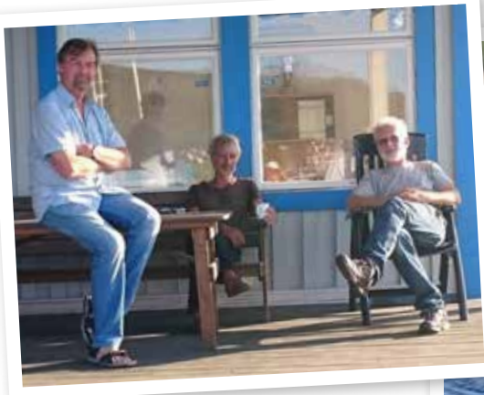
Tre mindre badbenägna herrar betraktar övningarna från 1:a parkett