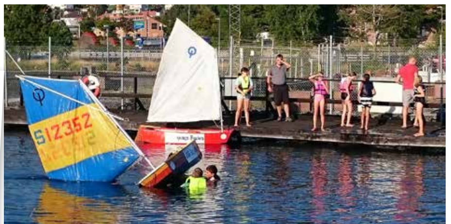
Att välla jollen är en uppskattad övning