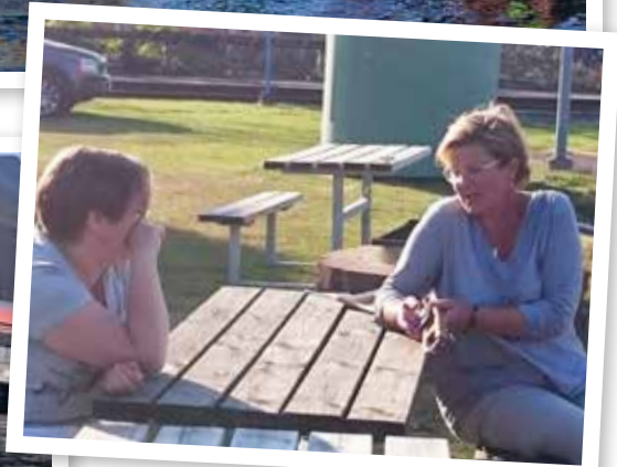
Ett bra tillfälle att diskutera annat också