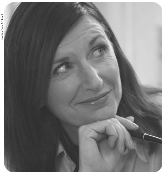
Nordea Bank AB (publ)