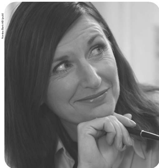
Nordea Bank AB (publ)