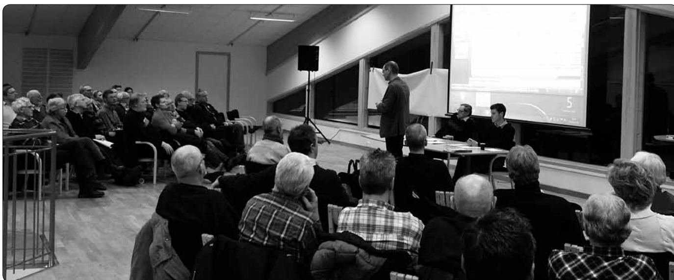
Årsmötet hölls hos Holmgrens Bil