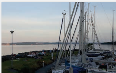
4-5 Sjöbo - ansiktet utåt