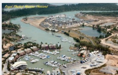
6-7 Pausad långsegling